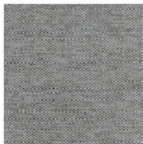
light grey 04