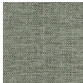
water green 17